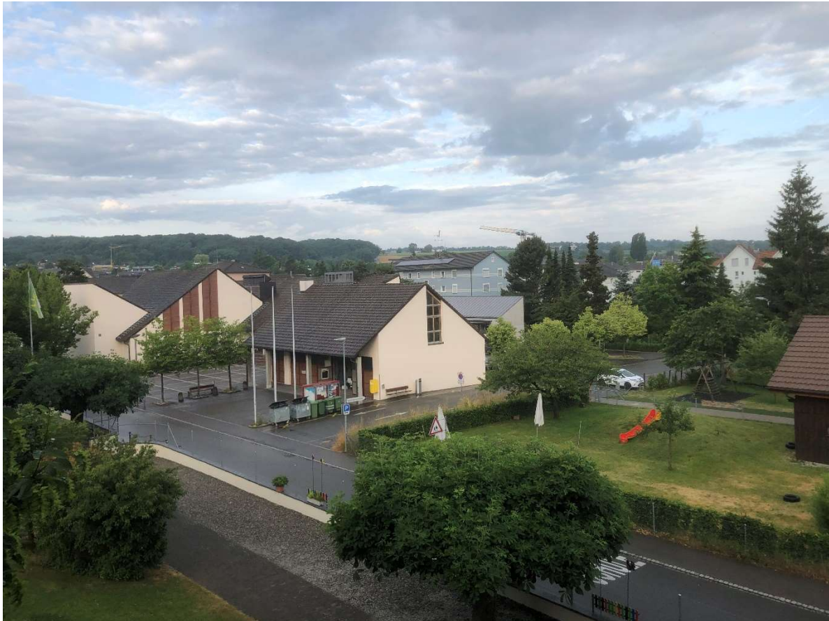
Bild: Standort des Neubaus Kindergarten und Hort.